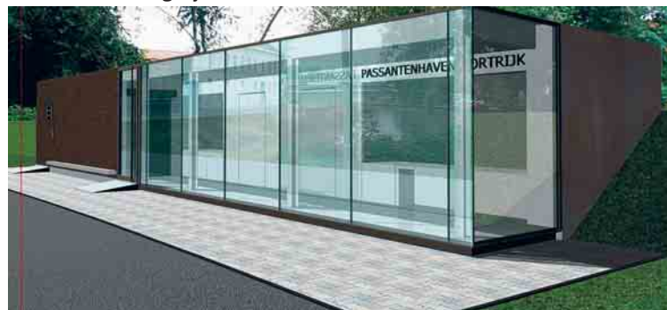
Simulatie van het op te trekken dienstgebouw bij de passantenhaven.

Het kostenplaatje is nog niet bekend. ‘Dat zal pas blijken als de