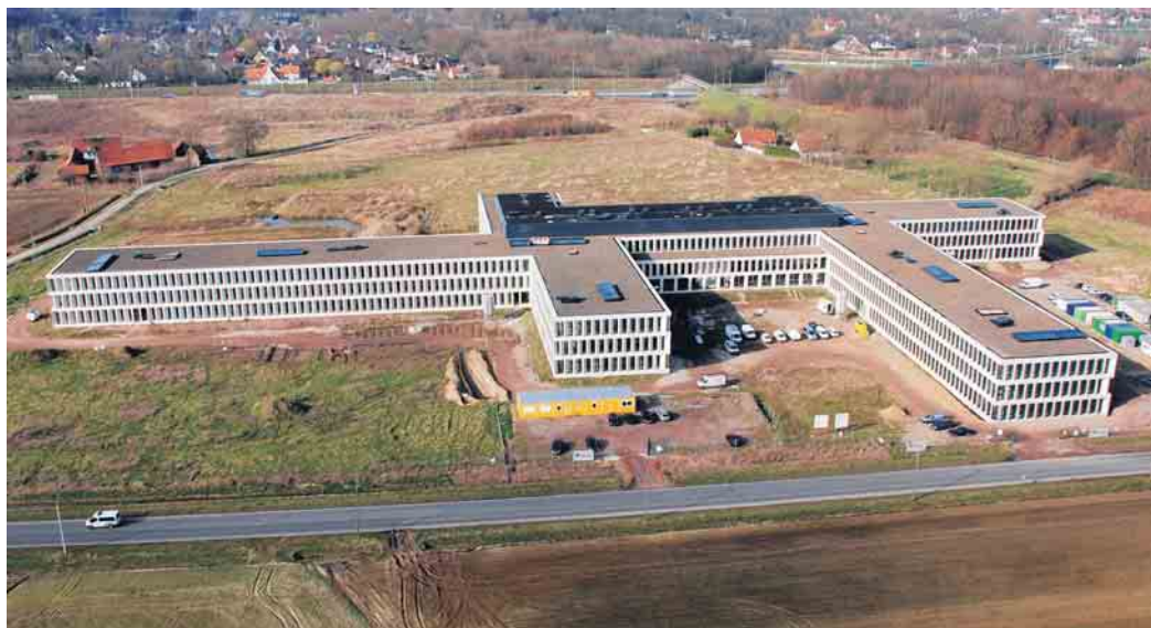
Het nieuwe ziekenhuis AZ Groeninge langs de Kennedylaan verwelkomt vandaag zijn eerste patiënt.