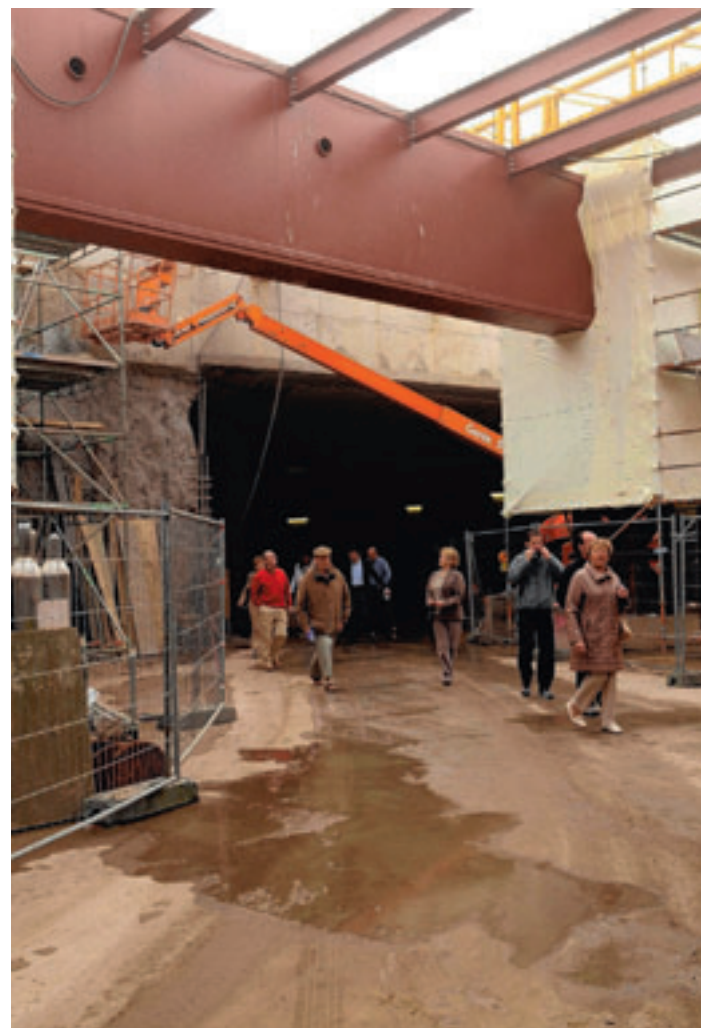
Veel nieuwsgierigen kwamen een kijkje nemen in de ondergrondse parking.

Geen Kzonder winkels. Commercieel blijft Foruminvest op koers. Het megawinkelcentrum zal 85 winkels, 21 appartementen en een handvol horecazaken omvatten. De laatste nieuwkomers zijn Shampoo, Geox, Blokker, Essentiel, Dervyn Barbier, Camaieu, Rituals, So Waf, Portrait Studio, Collecta en Twice As. Media Saturn, Hema, Massimo Dutti, Claudia Sträter, AP by Bruphils, Mayerline, Talking French, Biomarkt, Crinckles, I am, Triumph, America Today, Max Mara Weekend, Kidslab, Equiform, Appel's, L&L, Senza Paris Exclusif, Bruno Antognini, Mc Gregor, Grand Optical, Terre Bleu, Formen, Salt & Pepper, Donaldson, Sacha, Cool Cat, Street One, Bart Smit, E-Plaza, Gaastra, Cecil, Pull and Bear, Hunkemöller, Berschka, River Woods, Zara, Zara Home, H&M, Esprit, Six, Torfs, Swarovski, Didi, Belgacom, Steps, Noekie's, Standaard Boekhandel en Cosy House hadden al ingetekend.